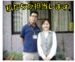
私たちが担当します。

要介護認定において、要支援1から2、要介護1から5と認定された方です。 まずは、担当ケアマネージャーまたはお住まいの地域包括支援センター担当者にご相談ください。 支援相談員が相談・面接を行います。